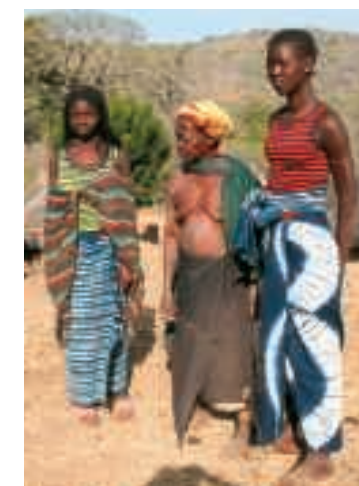
In alto. Il villaggio bedick di Iwol In basso. Donna bedick. Un'anziana che fila il cotone, e donne bedick.