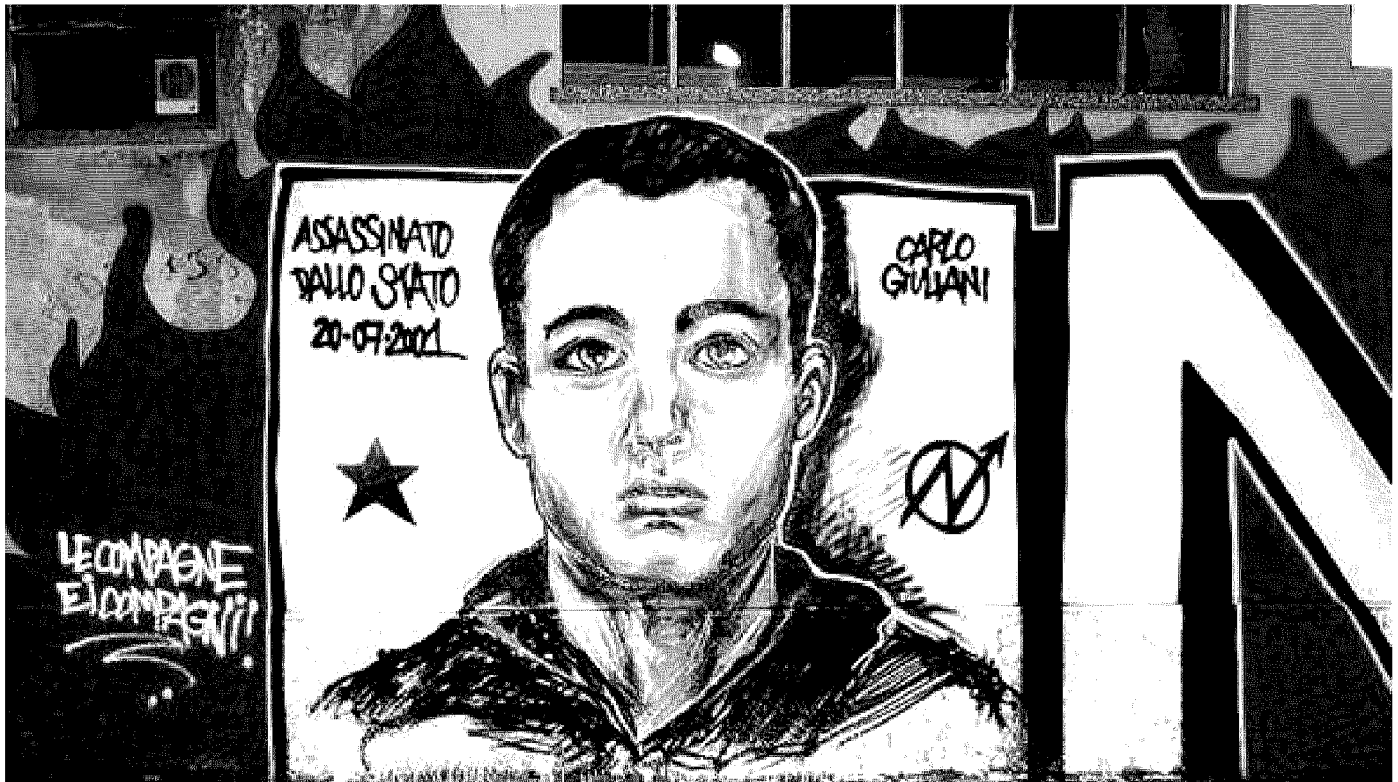
Il murales con il volto di Carlo Giuliani, ucciso durante il vertice internazionale G8 del 2001, è stato realizzato nei giorni scorsi in via Canevari a Genova